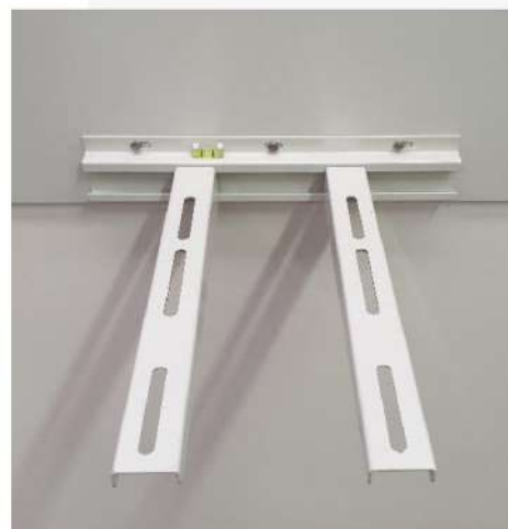
SISTEMA FISSAGGIO SCORREVOLE VENTILATORI A PARETE